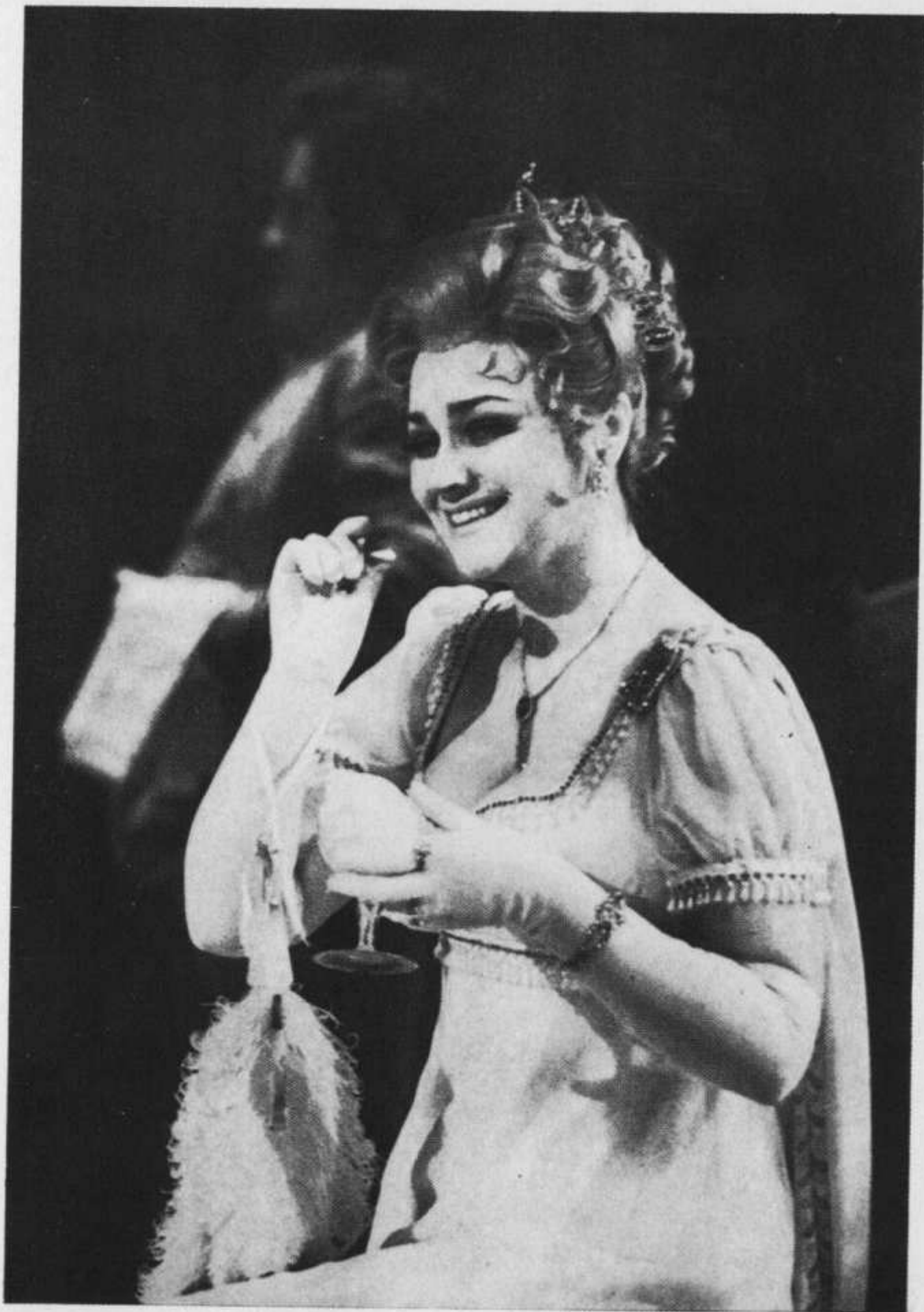
«Война и мир»