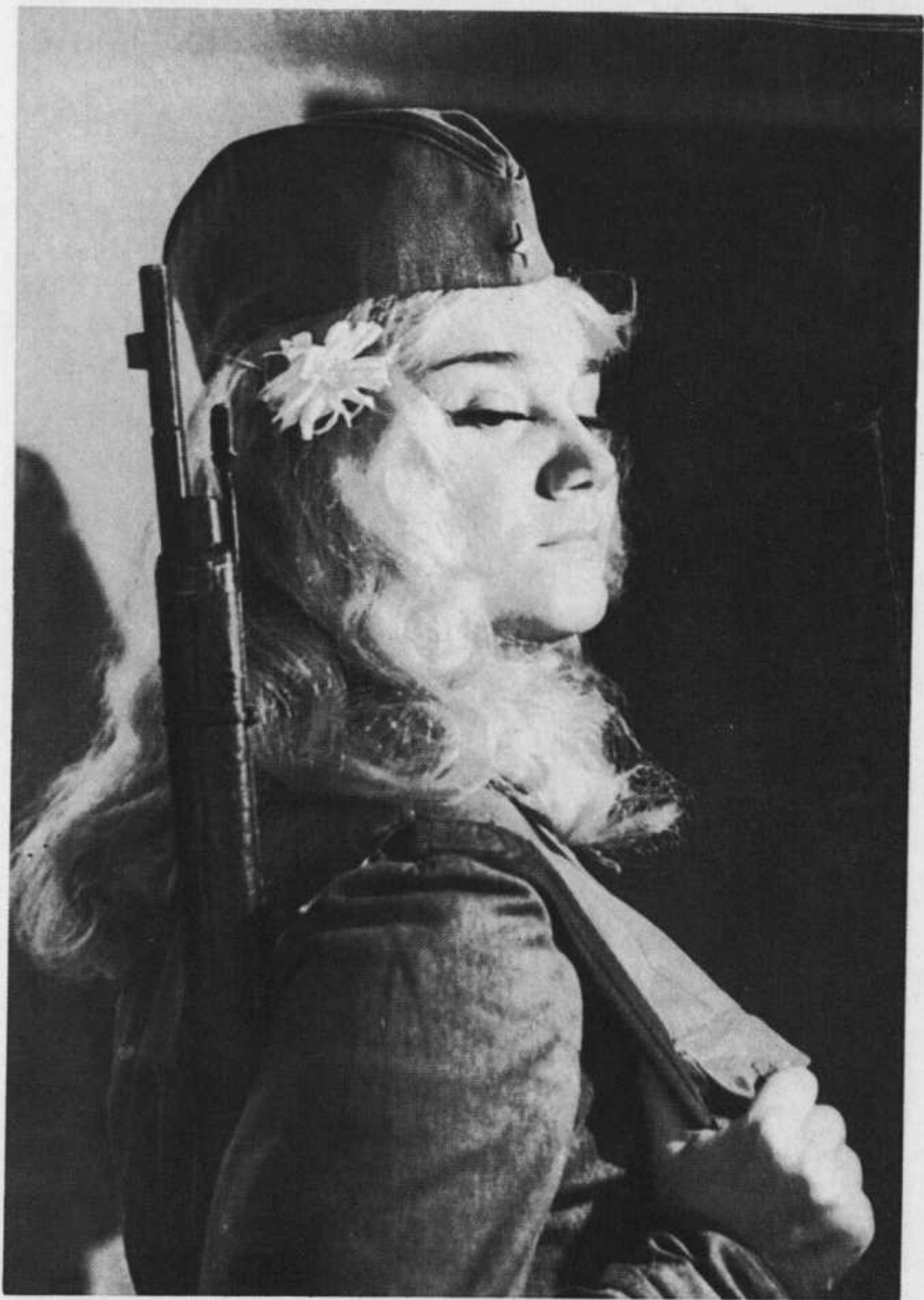
«Зори здесь тихие»