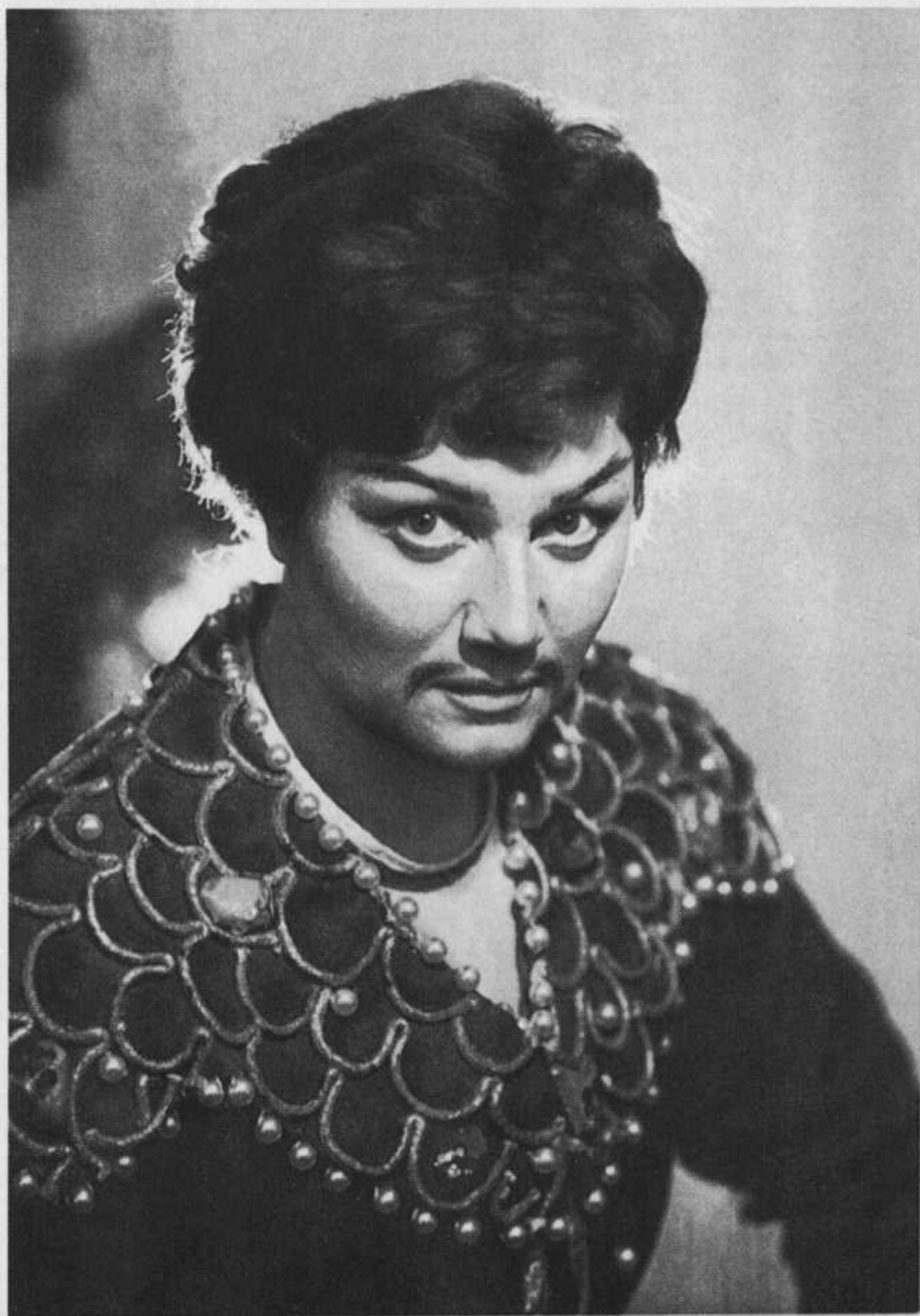
«Руслан и Людмила»